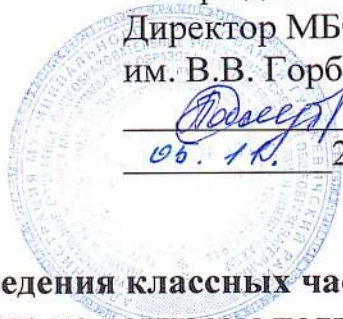
График проведения классных часов с выпускниками 11 класса по вопросам подготовки к ГИА в МБОУ СОШ №13 им. В.В. Горбатко